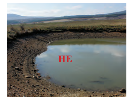
Езеро, изображ. 21, 22