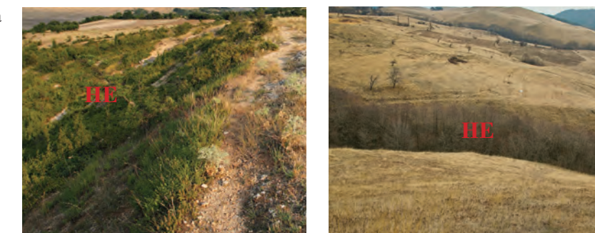
Дере, изобраз. 3, 4