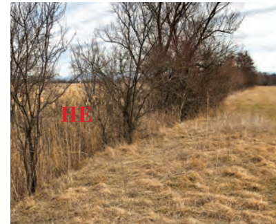
Канал, изображ. 27, 28