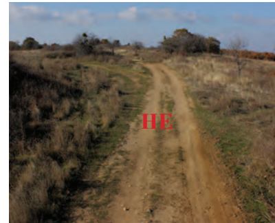
Полски път, изображ. 7, 8