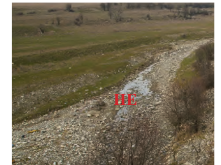
Река, изображ. 19;