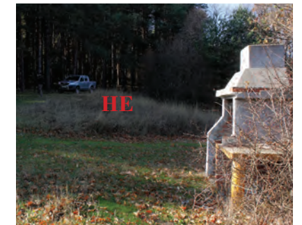
Зона за спорт, изображ. 17;