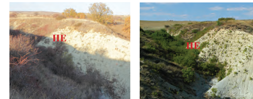
Овраг, изобраз. 5, 6