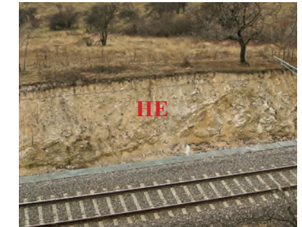
Железопътна линия, изображ. 37, 38