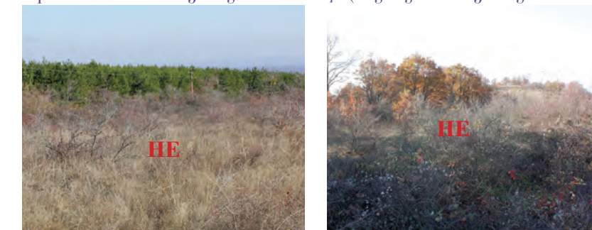
Храсти и запревени площи, изобраз. 1, 2