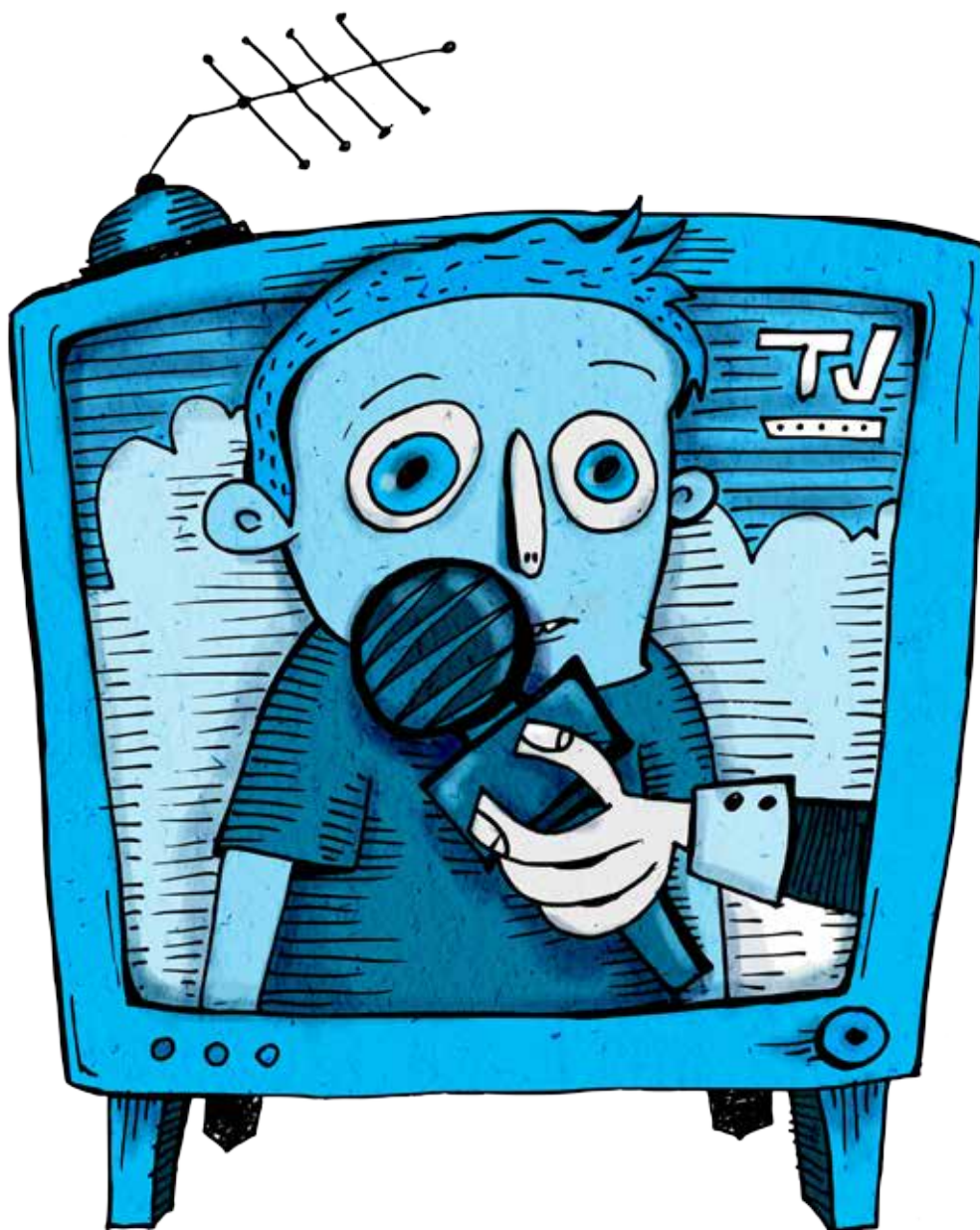
ФОТО- И ВИДЕОЗАСНЕМАНЕ НА ДЕЦА