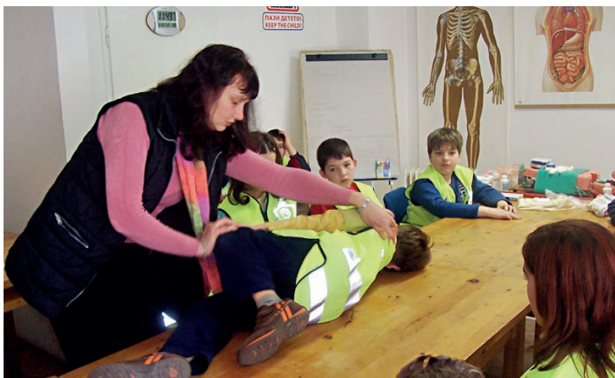
□ ДЕЦАТА НАУЧАВАТ КАК ДА СЕ СПРАВЯТ В КРИТИЧНИ СИТУАЦИИ