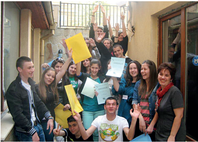
□ ЧАСТ ОТ ПРЕМИНАЛИТЕ ПРЕЗ АКАДЕМИЯТА МЛАДЕЖИ УЧАСТВАТ НА ДОБРОВОЛНИ НАЧАЛА В ДЕЙНОСТИТЕ НА СДРУЖЕНИЕТО, ВКЛЮЧИТЕЛНО КАТО МЕНТОРИ

„Деца възпроизвеждат житейския модел, който виждат и в който растат. Нашата надежда беше, че, показвайки им друг модел, ние ще им дадем шанс да променят живота си.“