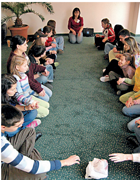
□ НЕФОРМАЛНО ГРАЖДАНСКО ОБРАЗОВАНИЕ НА ВРЪСТНИЦИ ОТ ВРЪСТНИЦИ. ЗАПОЧНАЛО ПО ПРОЕКТ НА ТЕАТЪР „ЦВЕТЕ“ ОТ 2007 Г., ПРОДЪЛЖАВА И ДО ДНЕС