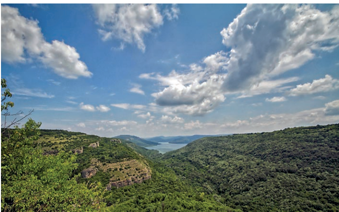
□ БЕЗ ДУМИ