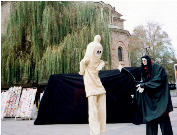
□ "ОПАСНА ЛЮБОВ" - УЛИЧНО КОКИЛНО ШОУ НА ТЕАТЪР "ЦВЕТЕ" В НАЦИОНАЛНИЯ ХЕПЪНИНГ В МЕЖДУНАРОДНИЯ ДЕН ЗА БОРБА С ХИВ И СПИН