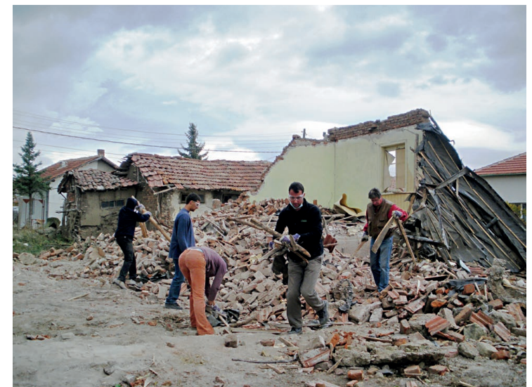
□ ДОБРОВОЛЦИ В МИСИЯТА „ПОДКРЕПИ ВЪЗСТАНОВЯВАНЕТО НА ПЕРНИК“ ПОМАГАТ ЗА РЕМОНТ НА ПОСТРАДАЛИ КЪЩИ ОТ ЗЕМЕТРЕСЕНИЕТО ПРЕЗ 2012 Г.

Друга кауза, която привлича страшно много доброволци, е тази на Khan Academy