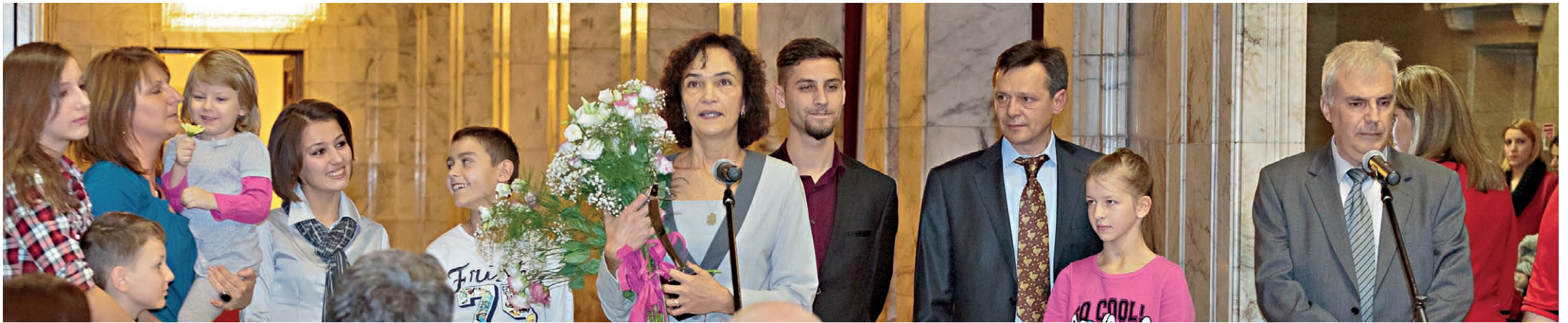
□ ЧАСТ ОТ ЕКИПА С ЧАСТ ОТ „ТЕХНИТЕ“ ДЕЦА

– „от подаването на заявлението за подкрепа до изпращането на детето на летището – всичко се случва във фонда“, обяснява тя. Споделя, че в момента институцията работи добре, макар да не липсват стресовите ситуации.