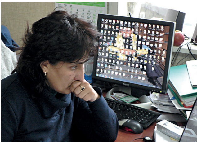
□ РАБОТНИЯ ПЛОТ НА ЕДИН МОНИТОР НЕ Е ДОСТАТЪЧЕН ЗА ПАПКИТЕ СЪС ЗАДАЧИ НА СПАСКА