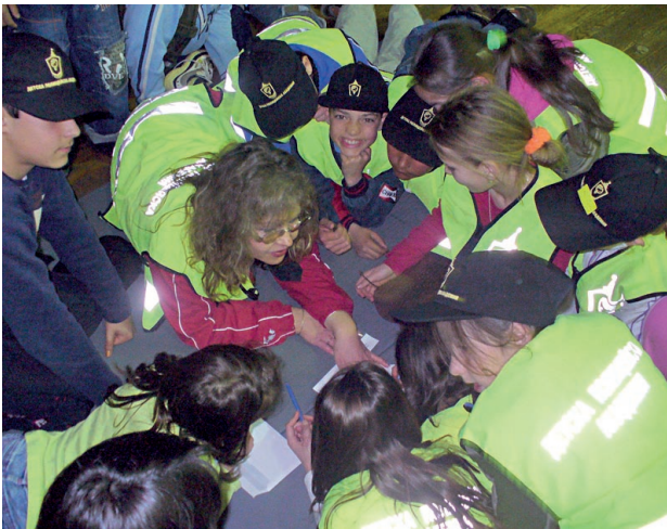
□ МАЛКИТЕ КАДЕТИ, ЗАВЪРШИЛИ АКАДЕМИЯТА, СА ПО-МАЛКО АГРЕСИВНИ И ПО-СКЛОННИ ДА ПОМАГАТ НА ХОРА В БЕДА