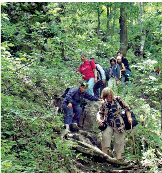
□ ЗДРАВ ДУХ В ЗДРАВО ТЯЛО – ЕКИПЪТ И ПАЦИЕНТИТЕ РЕДОВНО ПРАВЯТ ПОХОДИ, УЧАСТВАТ В ОБЩИНСКИ РАБОТНИЧЕСКИ ИГРИ, ХОДЯТ НА ФИТНЕС

вуването и на други услуги. Защитеното жилище за хора с психични проблеми, създадено през 2011 г. и финансирано в продължение на година от фондовете на Европейския съюз, осъществява идеята хората с психични проблеми да живеят в общността като равноправни и пълноценни граждани, да имат свой дом, самостоятелен живот и да бъдат щастливи. След края на проекта логиката и необходимостта от съществуването на такава социална услуга, която е в синхрон с европейските тенденции за т.нар. деинституционализация, сочат, че издръжката трябва да се поеме от държавния бюджет. Но заради административни неуредици с общинската управа в Пазарджик вече трета година екипът на „Човеколюбие“ поддържа услугата само с доброволен труд.