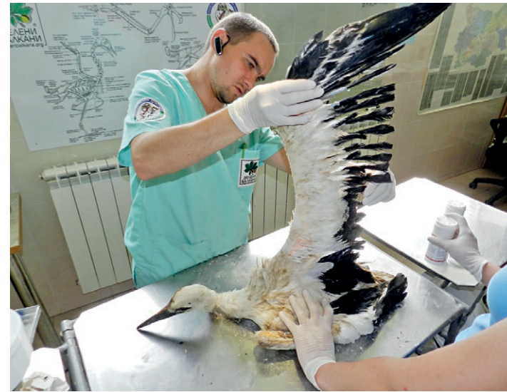
□ ПОВЕЧЕ ОТ 1500 ЖИВОТНИ МИНАВАТ ГОДИШНО ПРЕЗ ЦЕНТЪРА

Трайно увредените птици се използват за размножаване и като приемни родители