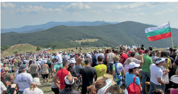
□ ЧЕСТВАНИЯТА НА ШИПЧЕНСКИТЕ БОЕВЕ СЪБИРАТ НАЙ-ГОЛЕМИ СУМИ ОТ ДАРИТЕЛИ, И ТО БЕЗ НИКОЙ ДА ОСИГУРЯВА НАСРЕЩНО ФИНАНСИРАНЕ