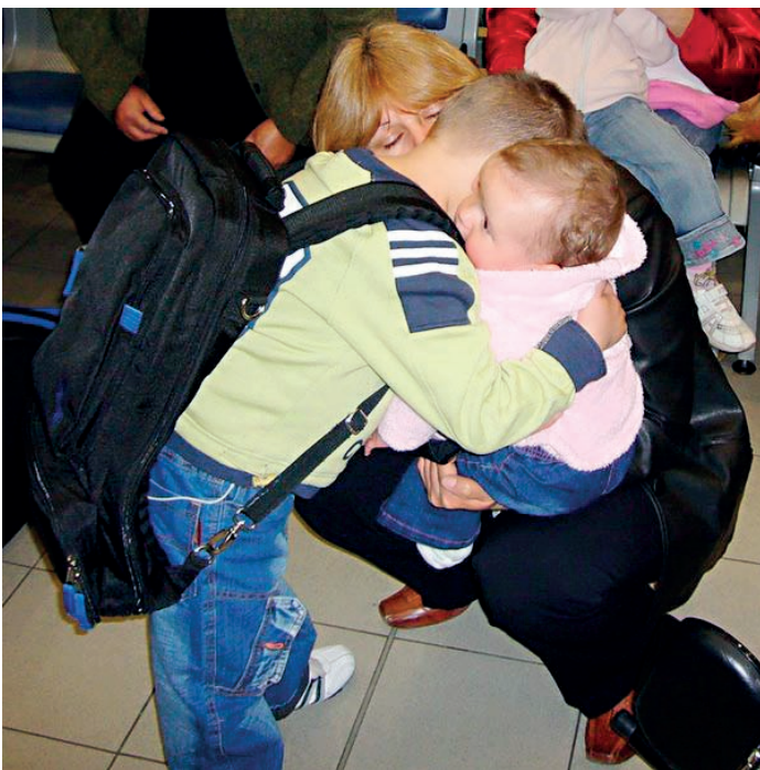
□ ГОШКО СЕ СБОГУВА С БАБА СИ И МАЛКАТА СИ СЕСТРИЧКА, ПРЕДИ ДА ЗАМИНЕ ЗА ОПЕРАЦИЯ В БОСТЪН, САЩ