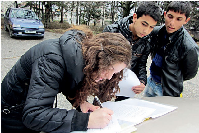
□ ПОДПИСВАНЕТО НА ДОГОВОРИТЕ С РОМИТЕ СТАВА НЕ ПРЕД ТЕЛЕВИЗИОННИ КАМЕРИ И ПОЗИРАЩИ ПОЛИТИЦИ, А НА ТЕРЕН – НА КАПАКА НА КОЛАТА НАПРИМЕР

максимално опростен формуляр от една страница (ехо, оперативните програми, чувате ли се?).