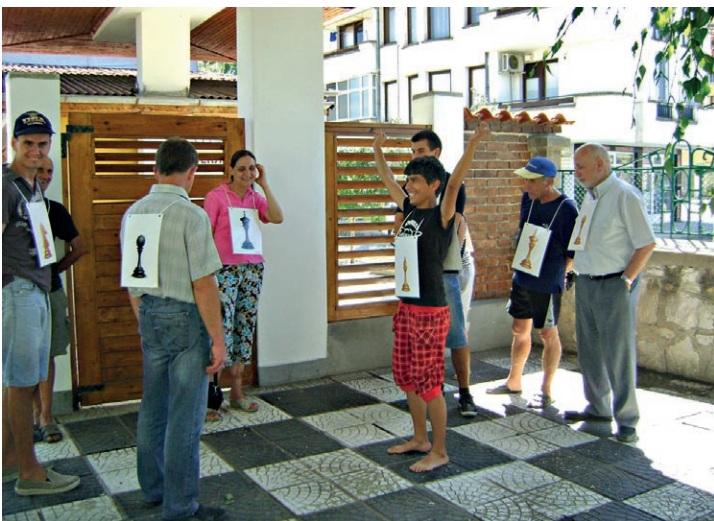
□ ШАХ С ЖИВИ ФИГУРИ – ПОСЕТИТЕЛИТЕ НА ЦЕНТЪРА ВЛИЗАТ В РОЛЯТА НА ШАХМАТНИ ФИГУРИ И ЗАЕДНО ОБСЪЖДАТ СТРАТЕГИЯТА НА СВОЯ ОТБОР