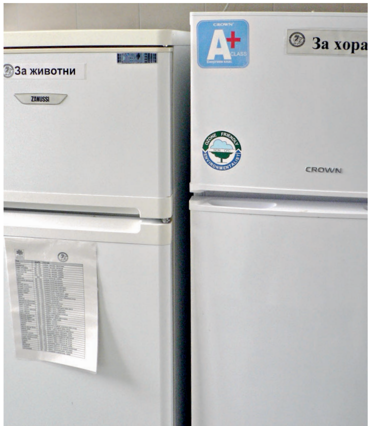
□ ТУК Е ТАКА

този единствен мигриращ вид сред лешоядите е много разпространен, но по редица причини, всички свързани човека, популацията му към днешна дата намалява със застрашителни темпове.