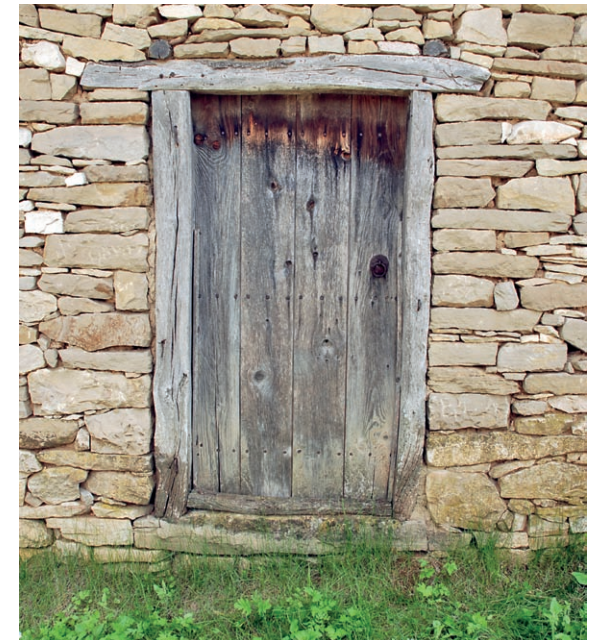
□ „ЗАТВОРЕНА ПОРТА - ТАКИВА БЯХА СЕЛАТА, КОГАТО ЗАПОЧНАХМЕ“, КАЗВА ИВА

Допитването до хората може да забавя процесите, но ги прави много по-устойчиви