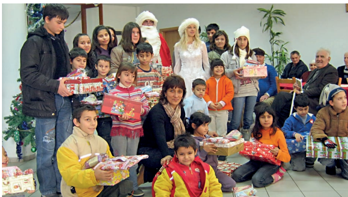
□ ЗА НЯКОИ ОТ ХОРАТА В РЕГИОНА ЕКИПЪТ НА „НОВ ПЪТ“ Е ЕДНОВРЕМЕННО РАБОТОДАТЕЛ, УЧИТЕЛ, ДОКТОР, ПАСТОР, ДЯДО КОЛЕДА...

как тези деца сграбчват кутиите и ги разкъсват и после - погледите им, като намерят лакомствата... А някои от тях получават обувки за пръв път в живота си... Изживяването е неопишуемо.”