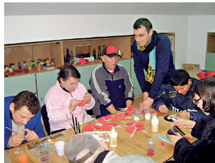
□ ПОСЕТИТЕЛИТЕ НА ЦЕНТЪРА САМИ ИЗРАБОТВАТ И ПРОДАВАТ МАРТЕНИЦИ ЗА БАБА МАРТА И СЪРЧИЦА ЗА СВЕТИ ВАЛЕНТИН