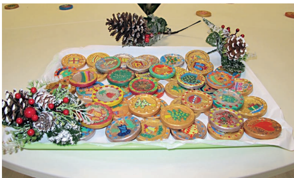
□ ВЪВ ВСЕКИ ВТОРИ ГАБРОВСКИ ДОМ ИМА ПОНЕ ЕДНО ДАРЧЕ - ГЛИНЕНА МОНЕТА, НАРИСУВАНА ОТ ДЕЦА, КОЯТО СЕ ВРЪЧВА НА ВСЕКИ ДАРИТЕЛ